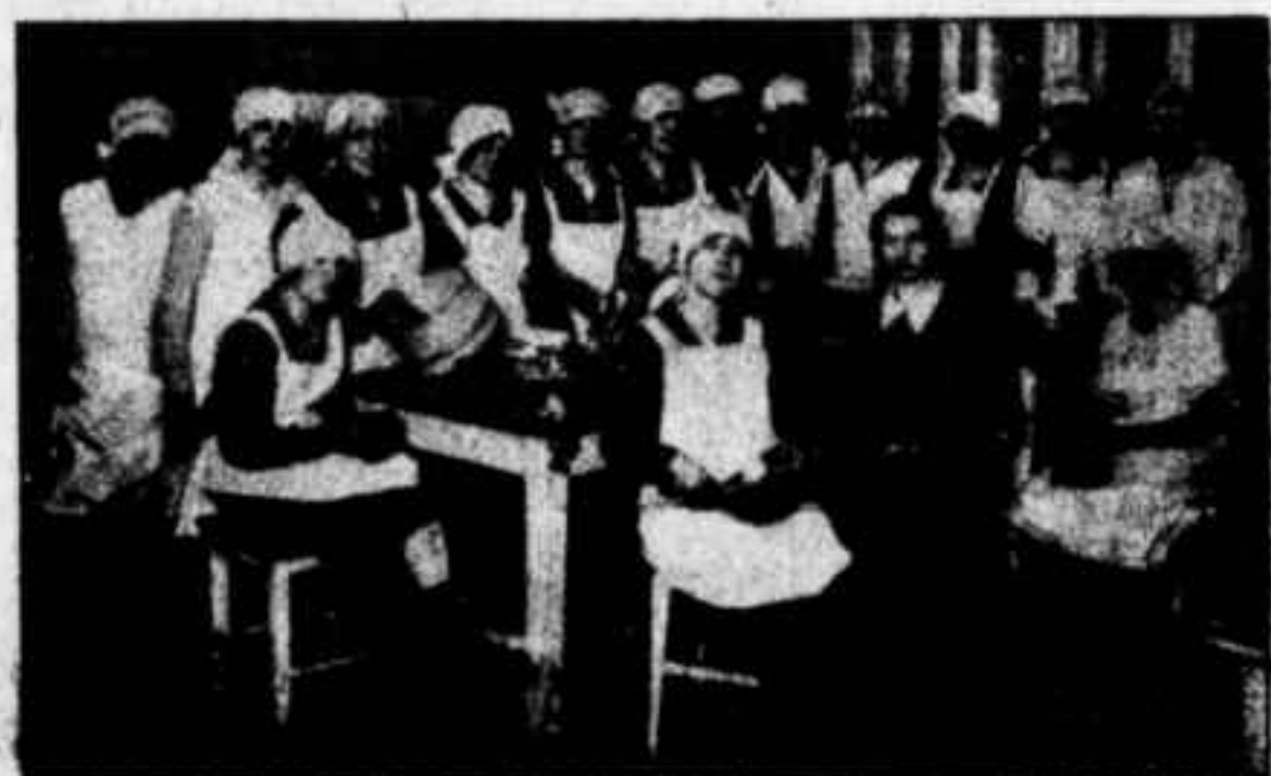
IX. kurs vaření pro dívky, zaměstnané v našich závodech.